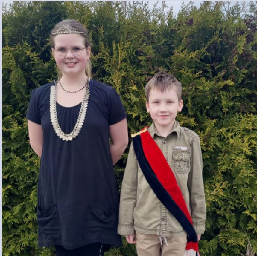
Kinderkönigspaar 2025 / 2026