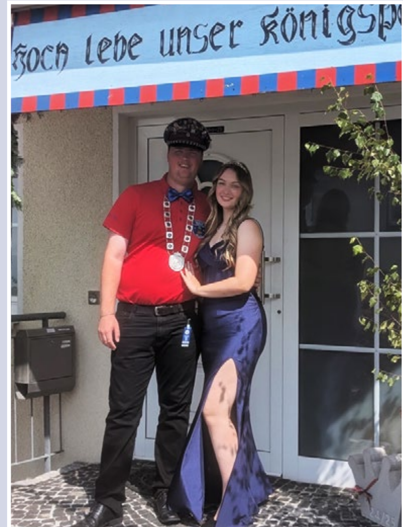
Jungschützenkönigspaar 2025 / 2026