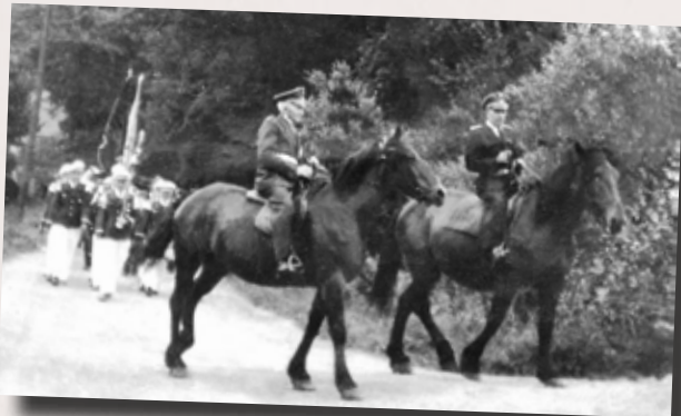
Hauptmann und Adju hoch zu Ross

Und obwohl es bis weit in das vergangene Jahrhundert hinein bei den dörflichen Schützen keine Uniformen gab und zum Fest der gute (und oft einzige!) Sonntagsanzug getragen wurde, war der Vorstand an den Schärpen, die in unterschiedlicher Form getragen wurden, erkennbar.