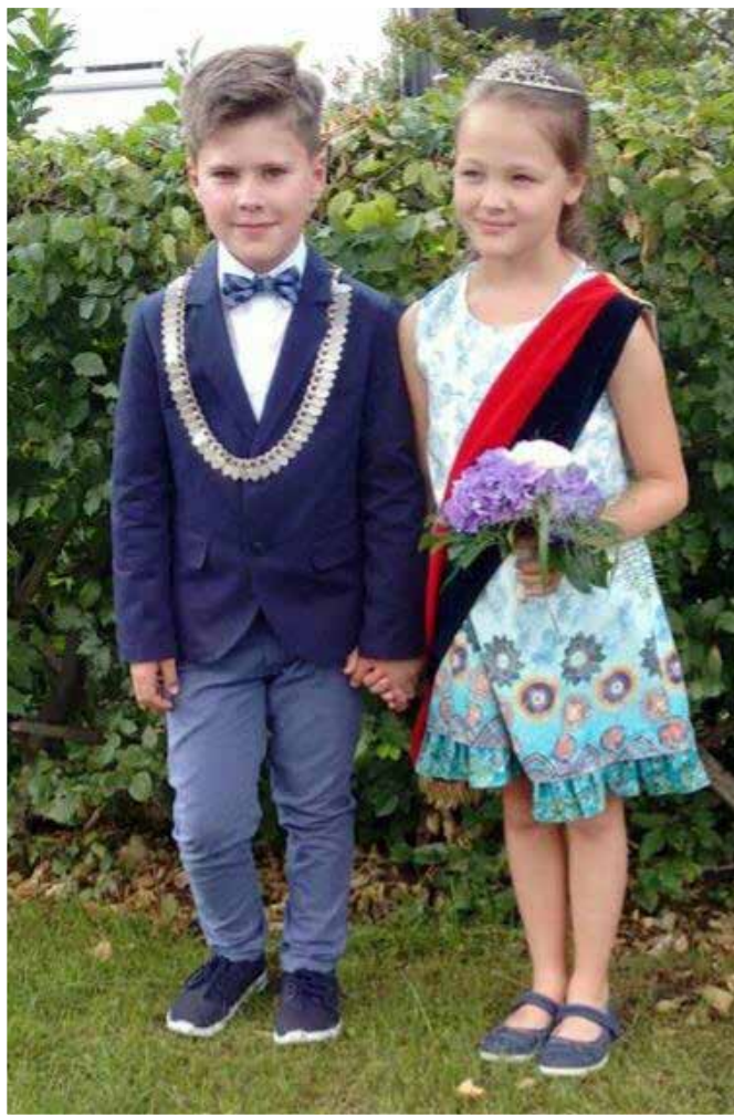
Kinderkönigspaar 2017 / 2018